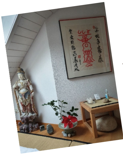
Shiatsu: auch ausprobieren